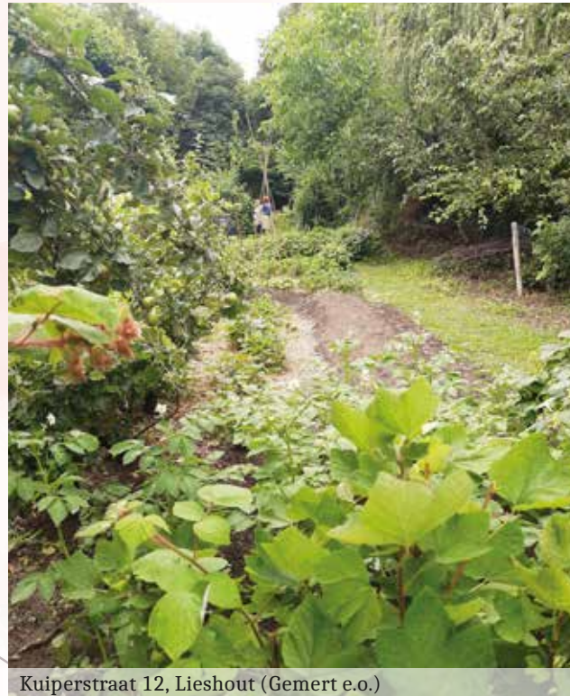
Kuiperstraat 12, Lieshout (Gemert e.o.)

4. Cees Meijer en Karin de Vos, Bakelseweg 14, Aarle-Rixtel. In het buitengebied van Aarle-Rixtel ligt de tuin met een geheel eigen karakter. Allerlei planten en bloeitijden wisselen zich af onder een mooie treurbeuk.