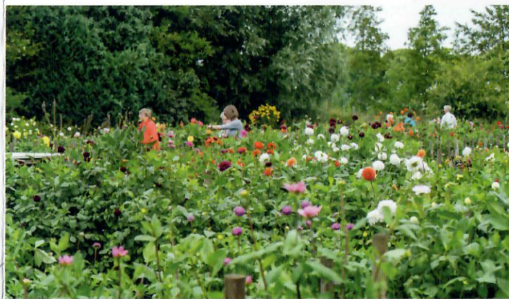
Bernhard van Damstraat, Eerde (Meierijstad)