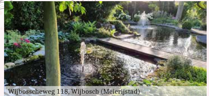
Wijbosscheweg 118, Wijbosch (Meierijstad)

6. Natuurtuin Meulenwiel, Broekdijk 9 5681PG Best. Deze tuin van 3000m 2 heeft een uitgebreid assortiment vaste planten (1600). De tuin heeft vele verharde paadjes waardoor je er makkelijk lang kunt wandelen en genieten. Er staan meerdere nestkastjes en onderkomens voor insecten en egels.