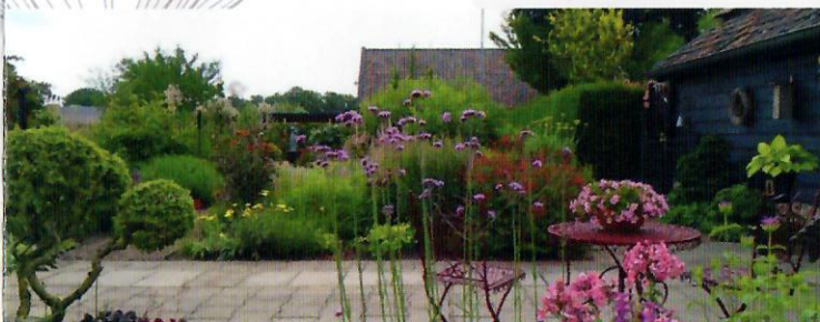
Goordonksedijk 10, Mariaheide (Meierijstad)