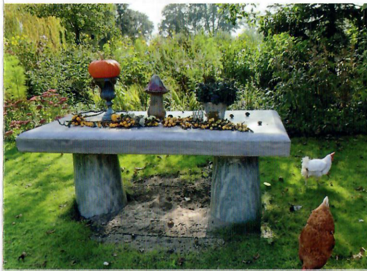
Bakelseweg 14, Aarle-Rixtel (Helmond)

8. Neerstraat 7, 5761RE Bakel. Bij een oude boerderij ligt een moestuin met verschillende fruitstruiken zoals frambozen en bessen. De eigenaar kweekt op eigen wijze vele soorten groenten.